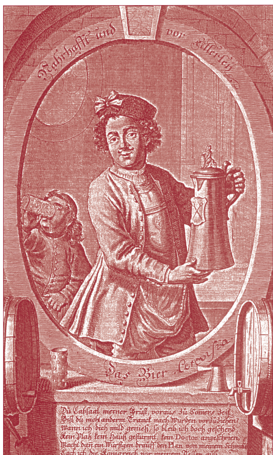
"Lob des Bieres" - Kupferstich von Martin Engelbrecht 1750